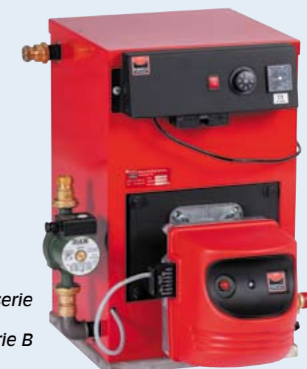
B-serie Série B